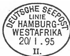
TAD maritime type 4 de la ligne II.