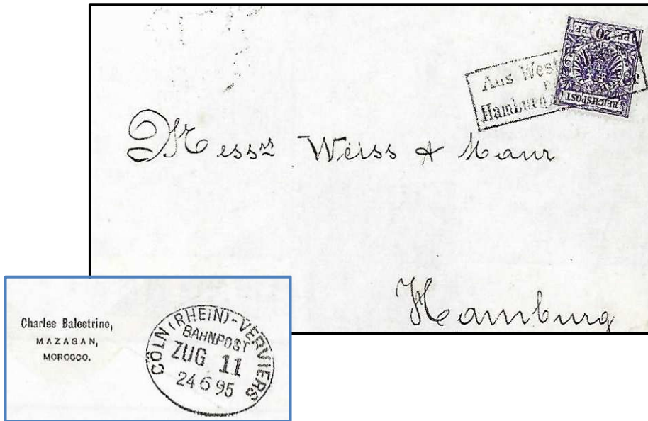
Lettre affranchie à 20 pfennigs adressée à Weiss & Maur à Hambourg et envoyée de Mazagan le 24 juin 1895. Cachet maritime type 1. Lot N° 6863 VSO Stuttgart 2005.