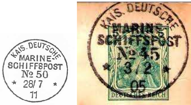
TAD maritime type 7 de la ligne N°50 et 45 sur le fragment.