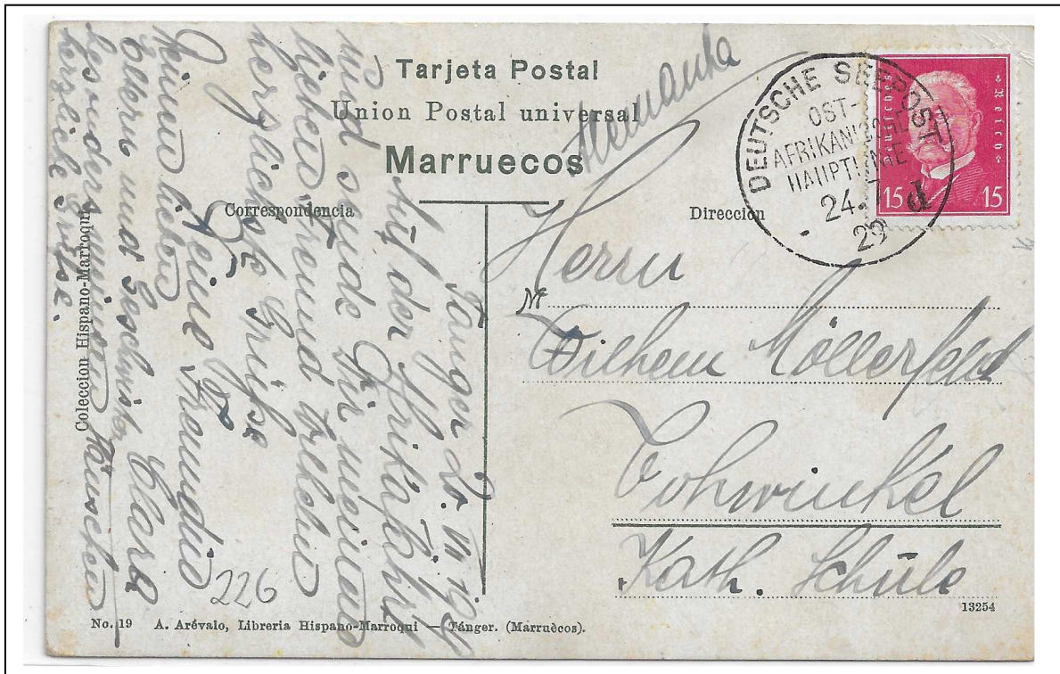
Carte postale adressée à Cohwinkel (Allemagne) et envoyée de Tanger le 20 juillet 1929, transport par paquebot allemand. TAD type maritime type 5, ligne d.

Pendant la première guerre mondiale tous les ports situés dans la zone française (Casablanca, Mazagan et Mogador) ont été fermés pour le transport du courrier allemand. Seuls restaient ouverts ceux situés dans la zone espagnole : Alkassar, Arsila, Larash et Tetuan, du 1 er août 1914 jusqu'au 11 juin 1919.