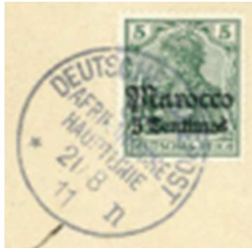
TAD maritime type 5 de la ligne d et ligne n sur fragment.