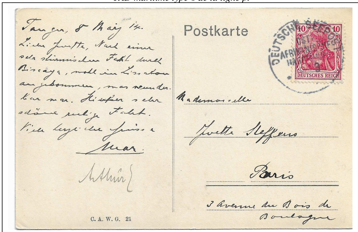
Carte postale adressée à Paris et envoyée de Tanger le 8 mars 1914, transport par paquebot allemand. TAD type maritime type 6.