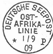
TAD maritime type 6 de la ligne p.