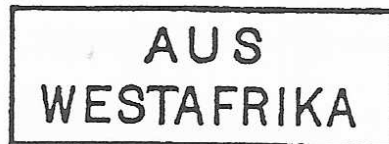
Cachet maritime type 2