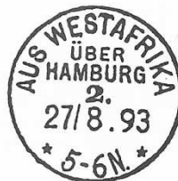
TAD maritime type 3