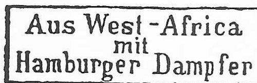
Cachet maritime type 1