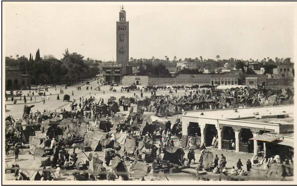
Immuable Koutoubia, immuable bureau de Poste !