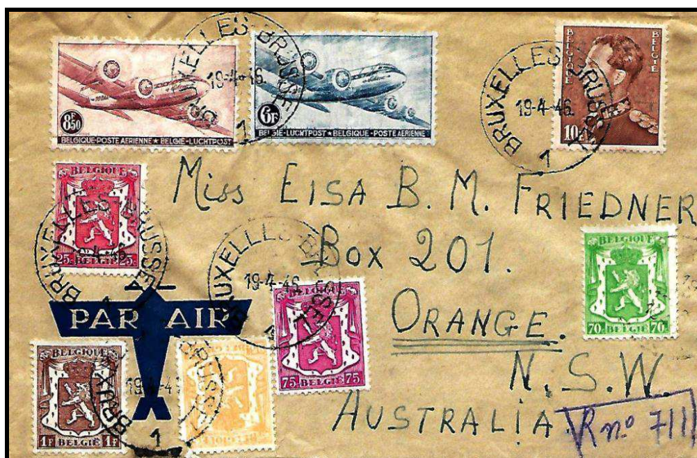
Fig. 1 : recto d'une lettre recommandée du 19.4.1946 de BRUXELLES 1 à ORANGE (NSW).

Aussi je désirais compléter cette lacune en montrant ici 3 lettres aériennes vers l'OCEANIE, deux vers l'Australie et une vers la Nouvelle-Zélande, pendant la période de l'usage le plus intensif des timbres « DAKOTA ».