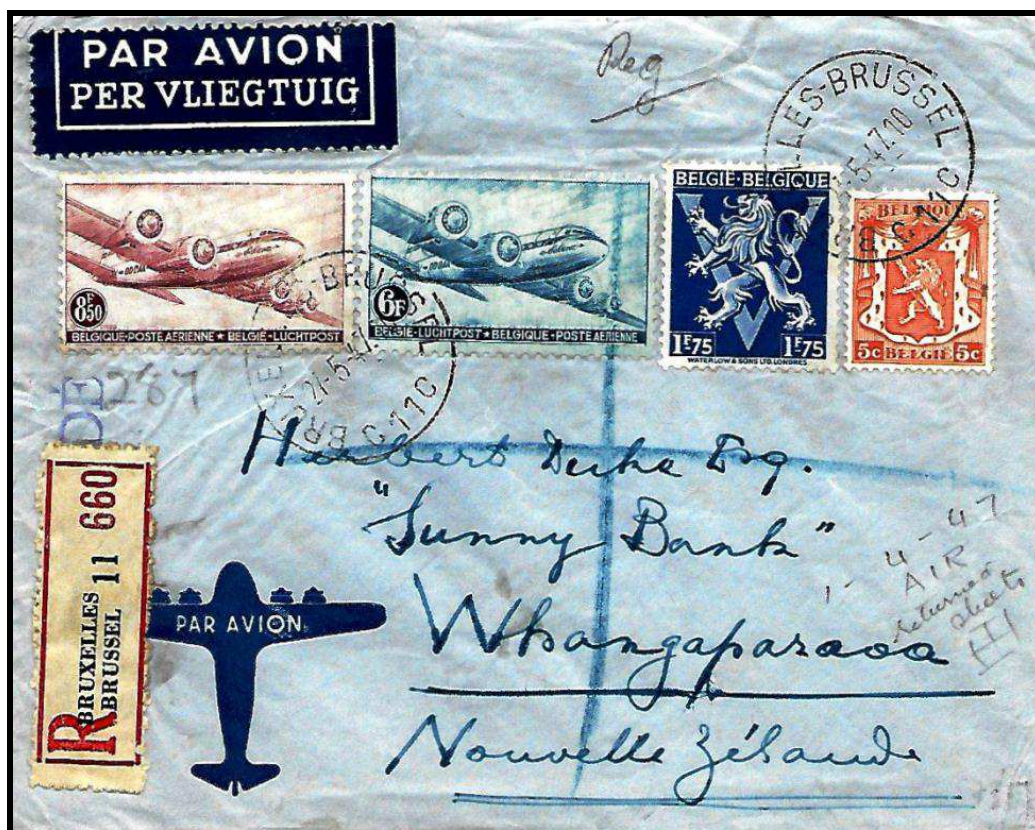
Fig. 4 : Une lettre recommandée du 27 mai 1947 de BRUXELLES 11 à WHANGAPARAOA (Nouvelle-Zélande).

Enfin pour élargir ce petit tour d'horizon consacré à l'Océanie, une lettre recommandée envoyée à WHANGAPARAOA en Nouvelle-Zélande, affranchie notamment avec les PA 8 et 9, depuis BRUXELLES le 27 mai 1957 au tarif exact de 16,30 Fr pour une lettre du 1 er échelon (3,15 + 3,15 Fr pour la recommandation et 10,00 Fr pour une LO jusqu'à 5 gr.).