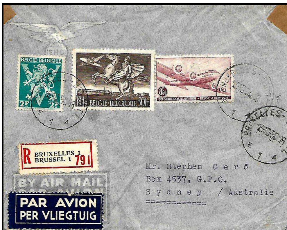
Fig. 3 : Une lettre recommandée du 13.10.1950 de BRUXELLES 1 à SYDNEY.

Une autre lettre recommandée part de BRUXELLES 1 le 13 octobre 1950 à destination de SYDNEY (Australie). Elle est affranchie correctement à 60,50 Fr pour une lettre de plus de 20 gr, au 5 ème échelon aérien, soit 4,00 + 2,50 Fr pour un DOUBLE PORT + 4,00 Fr pour la recommandation et 5 x 10 Fr pour un 5 ème échelon aérien (fig. 3).