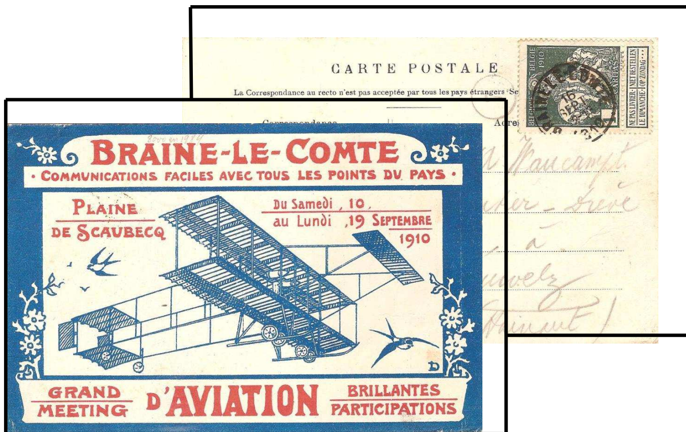
Fig.2 : recto et verso de la carte postale de propagande du meeting d'aviation de BRAINE-LE-COMTE, postée le vendredi le 16 septembre 1910 de BRAINE-LE-COMTE vers PERUWELZ.

John DEMONJOZ , pilote suisse né à Genève en avril 1886, invente en 1913 avec Adolphe PEGOUD la voltige aérienne et ils seront les premiers à réaliser des loopings.