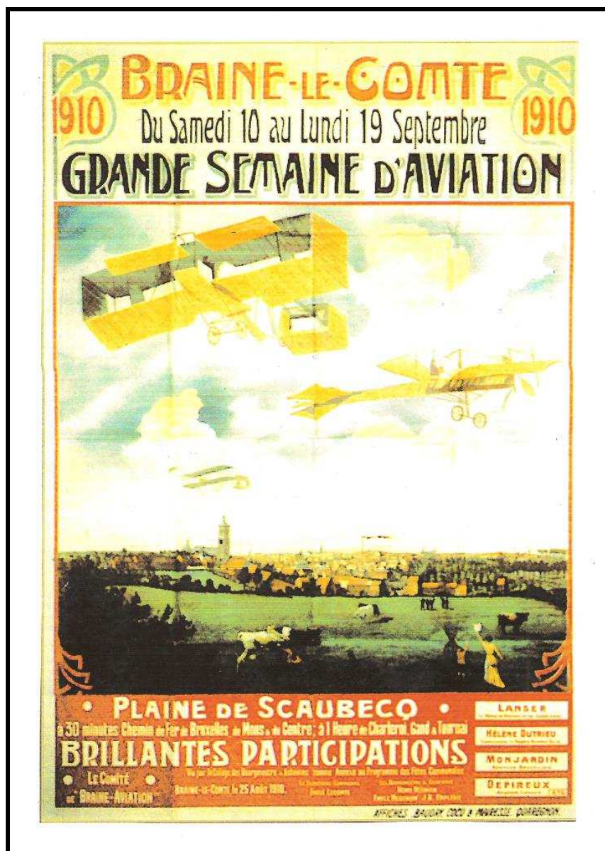
Fig.1 : affiche officielle annonçant la grande semaine d'aviation de BRAINE-LE-COMTE, ayant lieu du 10 au 19 septembre 1910.