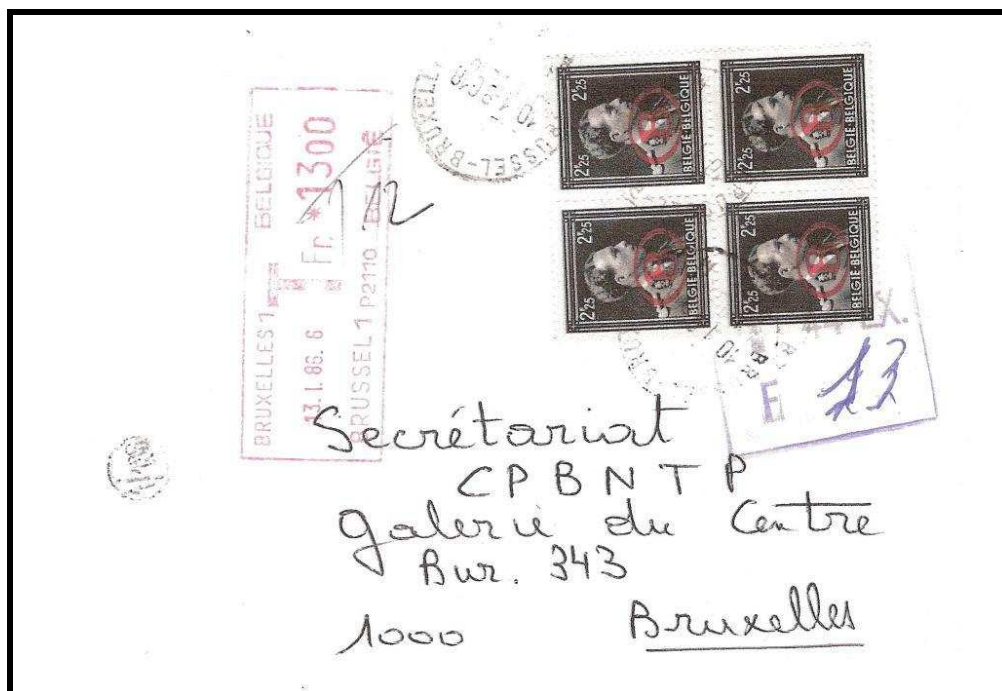
Fig. 5 : bloc de 4 timbres de service S35 sur lettre taxée mécaniquement à 13 FB.