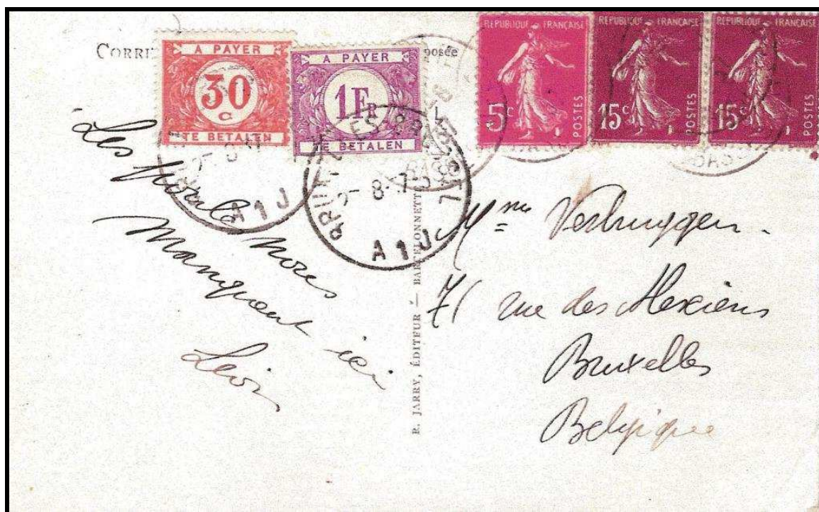
Fig. 1 : carte illustrée de France taxée à l'arrivée en Belgique à 1,30 FB par double de 65 c. manquant.

Les timbres taxe furent eux émis et servirent pendant de nombreuses années. De 1870 jusqu'en 1988 où la poste décida qu'il était trop coûteux de vérifier le montant des taxes et cessa de récupérer parfois des montants dérisoires.