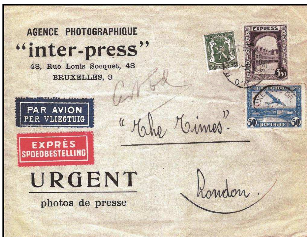
Fig. 6 : enveloppe d'une agence de presse de Bruxelles pour Londres.

Les photos étant considérées comme imprimés, l'affranchissement est de 35 c. pour l'envoi; de 3,50 FB pour la taxe d'express et de 50 c. pour la taxe aérienne.