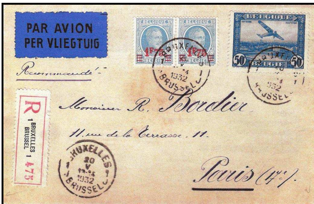
Fig. 2 : lettre recommandée envoyée de Bruxelles à Paris (F); tarif de la lettre : 1,75 FB, tarif de la recommandation : 1,75 FB et la taxe aérienne : 0,50 FB.

La collection de ces timbres a attiré de nombreux collectionneurs ainsi que celle des chemins de fer mais vu leur disparition, il est certain que dans l'avenir ces études disparaîtront.