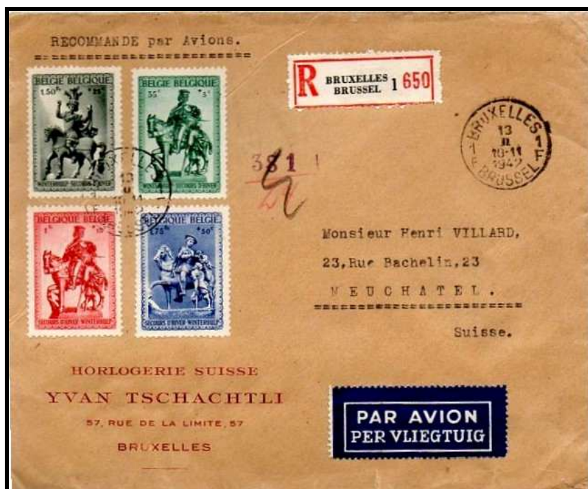
Fig. 2 : lettre par avion ( ? ) de Bruxelles à Neuchatel (CH) du 13 février 1942 (réduit à 66 %)