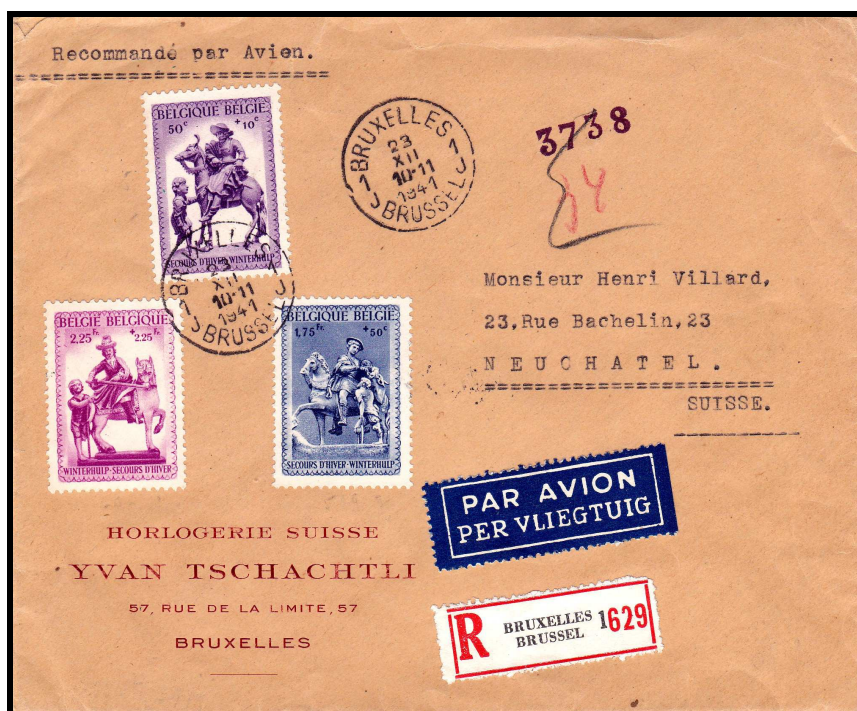
Fig. 1 : lettre par avion ( ?) de Bruxelles à Neuchatel (CH) du 23 décembre 1941 (réduit à 66 %)

La première a été postée le 23 Décembre 1941 et est arrivée à Neuchâtel le 31 décembre, ce qui était un temps tout à fait normal pour un voyage ferroviaire pendant la période de Noël.