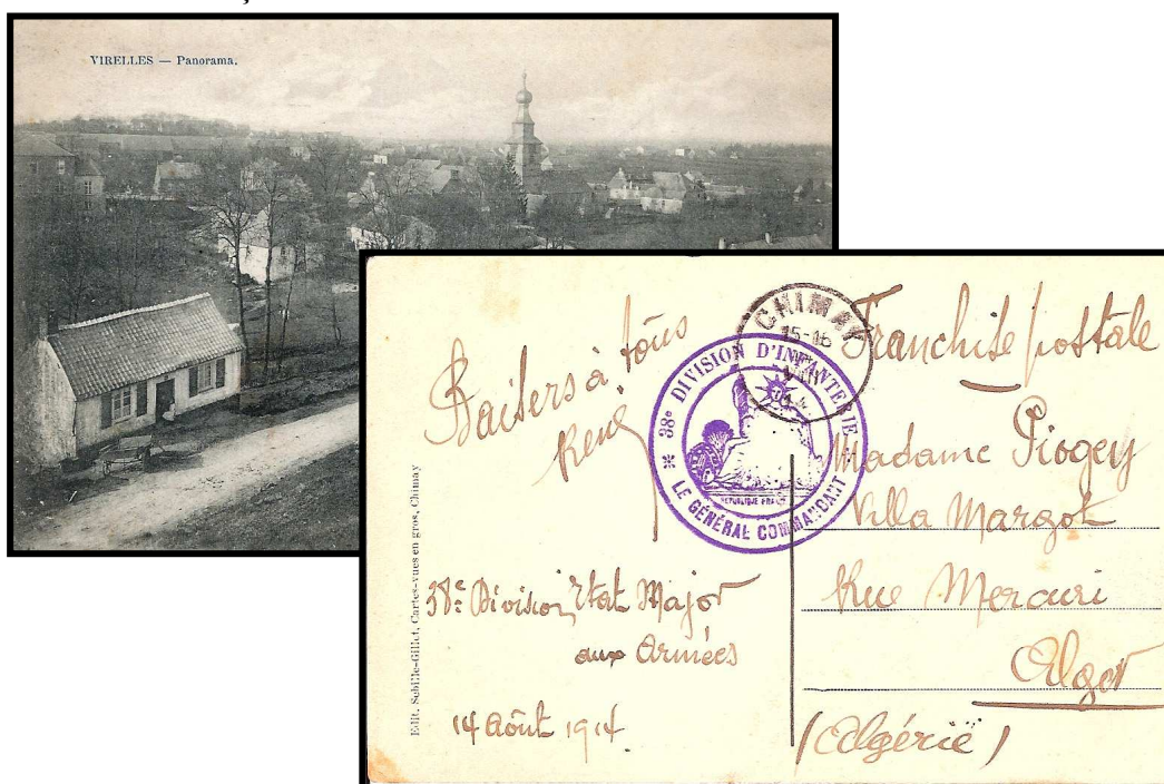
Fig. 1 : 14 août 1914 - Carte postale de Virelles (province du Hainaut) envoyée par un militaire français à Alger, en franchise postale, via la poste belge de Chimay. Marque de franchise de la 38 ème division d'infanterie d'Algérie qui participera le 22 et le 23 août 1914 à la bataille de Charleroi.

Au début de la guerre, les soldats ont souvent utilisé pour leur courrier des cartes postales des localités où ils étaient de passage afin d'indiquer ainsi à leur famille où ils se trouvaient. Ces cartes avec des vues de localités belges portent des cachets Trésor & Postes ou, quand elles ont été confiées à un bureau de la poste belge, comme la carte ci-dessous, la marque de franchise militaire d'une unité de l'armée française.