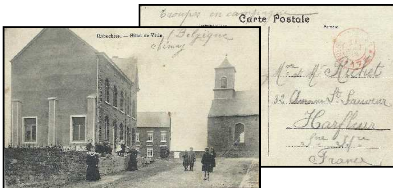
Fig. 3 : 20 août 1914 - Carte postale de Robechies (province du Hainaut) envoyée par le Trésor & Postes 175 du Quartier général du 3 e corps d'armée.

" ... nous n'avons pas encore pris le contact. Pour le moment nous ne faisons que de toutes petites étapes; évidemment nous sommes dans une situation d'attente ... "