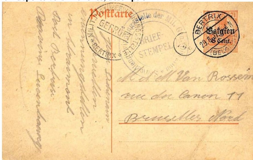
Fig. 2 : Entier postal envoyé de Saint-Médard le 28 août 1917 vers Bruxelles-Nord, censuré et oblitéré à Bertrix le 29 août 1917 et muni d'un cachet de l'administration allemande ( Centre de production de traverses de la direction générale militaire des chemins de fer).