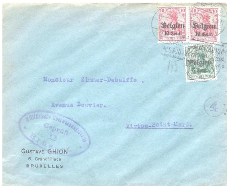
Fig. 4 : Enveloppe envoyée de Bruxelles vers Virton-Saint-Mard le 16 octobre 1917, affranchissement 25 cent.

Censure de départ : Bruxelles, Censure à l'arrivée de la 5 ième Armée, à Arlon, accompagnée d'un cachet, violet, de censeur n° 4 dans un cercle ( le même que celui de notre envoi ).