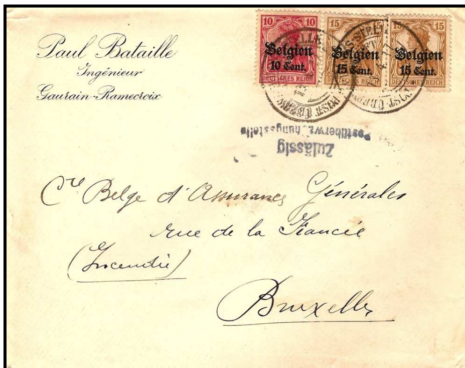
Fig. 4 : cachet « POST-ÜBERWACHUNGS-STELLE » sur lettre de GAURAIN-RAMECROIX, datée du 13 avril 1917 vers BRUXELLES.

La décision de supprimer toute référence à une localité déterminée dans les cachets à date militaires allemands a conduit à l'enlèvement du nom de TOURNAI. La version amputée de ce cachet apparaît pour la première fois le 13 avril 1917 et a servi jusqu'à la libération (fig. 4).