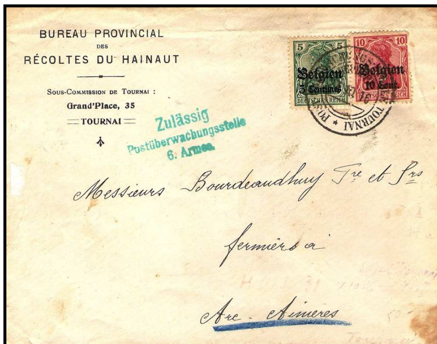
Fig. 2 : cachet « POST ÜBERWACHUNGS-STELLE TOURNAI » sur lettre de TOURNAI, datée du 23 octobre 1916 vers ARC-AIMERIES.

Le dernier jour d'utilisation du cachet belge de TOURNAI et le premier jour d'utilisation du cachet allemand se situent donc entre le 17 et le 23 octobre 1916.