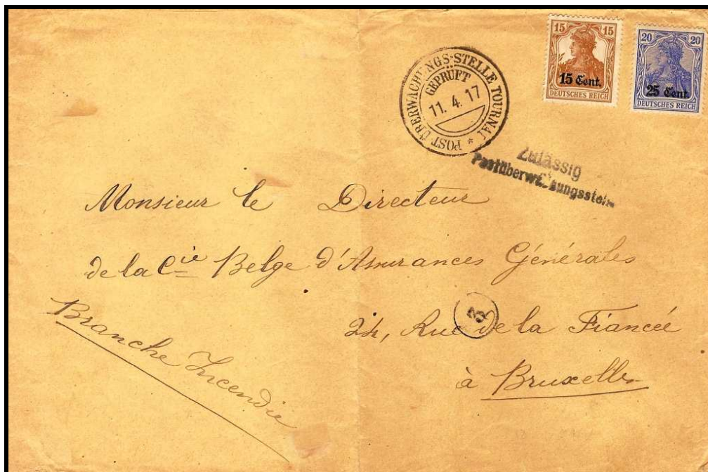
Fig. 3 : cachet « POST ÜBERWACHUNGS-STELLE TOURNAI » sur lettre de TOURNAI, datée du 11 avril 1917 vers BRUXELLES.

Dans son état intact, le cachet allemand a servi jusqu'au 11 avril 1917 (fig. 3), peut-être encore le 12 avril 1917, soit six mois environ.