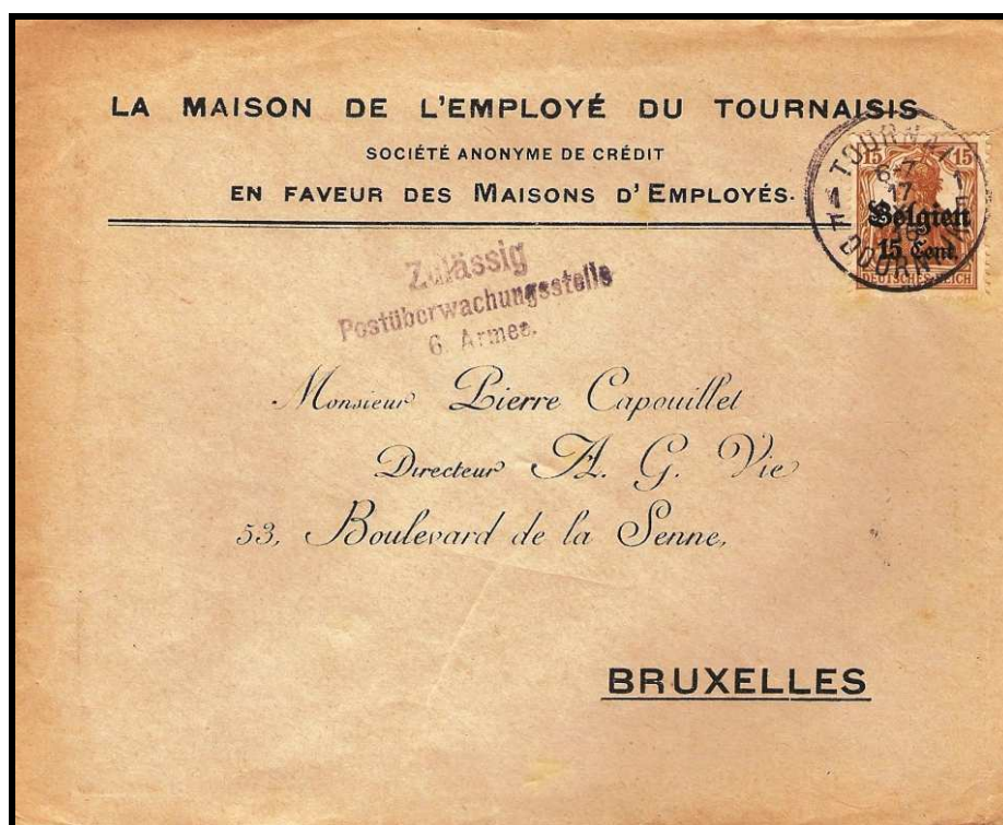
Fig. 1 : Cachet « TOURNAI / DOORNIK 1 F » sur lettre de tournai, datée du 17 octobre 1916, vers BRUXELLES.

En attendant la confection d'un cachet à date propre de la « POSTÜBERWACHUNGSSTELLE » à TOURNAI, le cachet simple cercle de TOURNAI / DOORNIK 1 F a continué à servir au moins deux semaines encore. La dernière date d'utilisation rencontrée est le 17 octobre 1916 (figure 1).