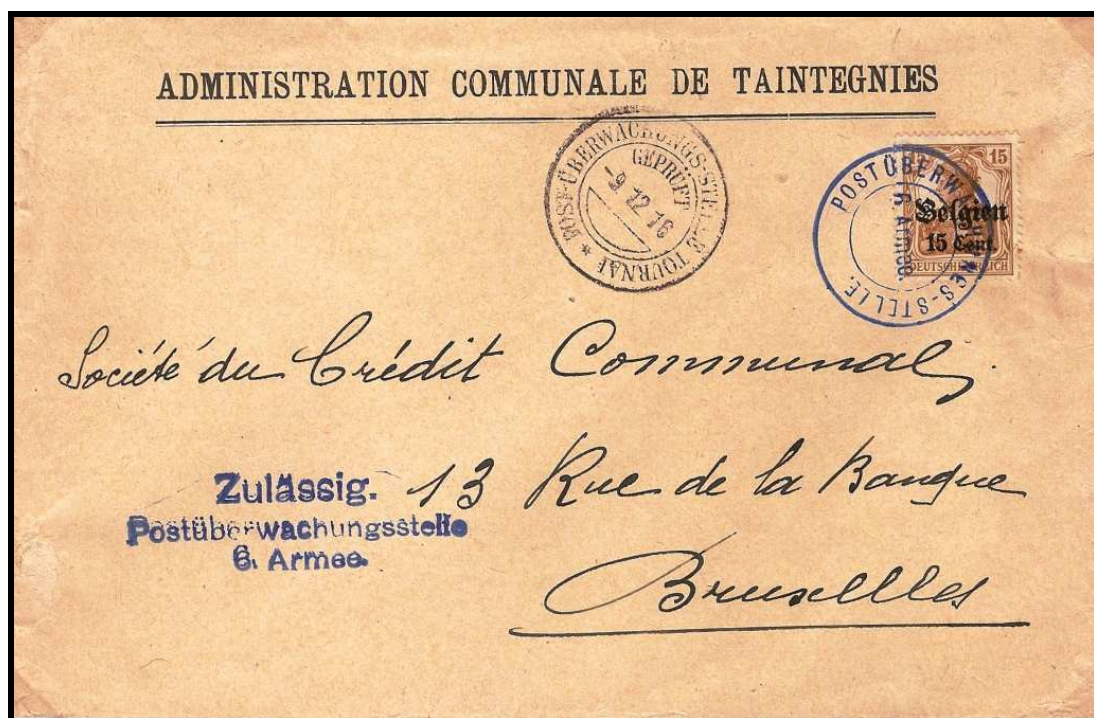
Fig. 4 : « POSTÜBERWACHUNGS-STELLE (au milieu : « 6. ARMEE ») sur lettre de la commune TAINTEGNIES (estampille en bleu).

Mais cette marque existe aussi en rouge et en lilas sur des correspondances privées de ou vers le Hainaut (fig. 5 et 6).