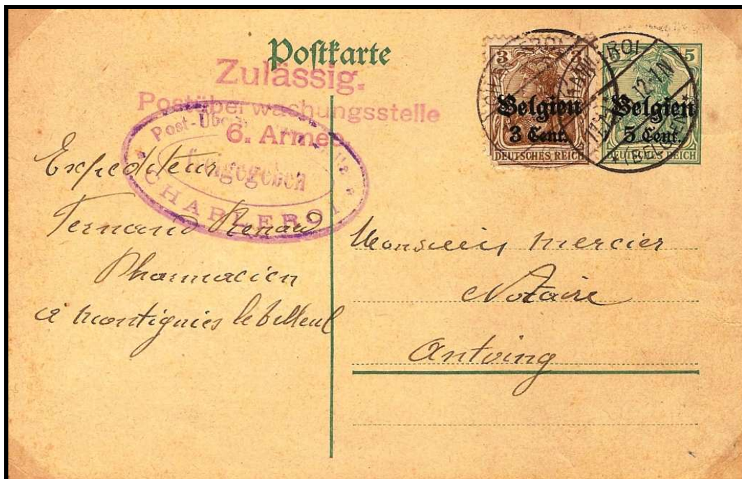
Fig. 5 : Carte postale de CHARLEROI, datée du 11 décembre 1916, vers ANTOING (estampille en rouge).

Mais cette marque existe aussi en rouge et en lilas sur des correspondances privées de ou vers le Hainaut (fig. 5 et 6).