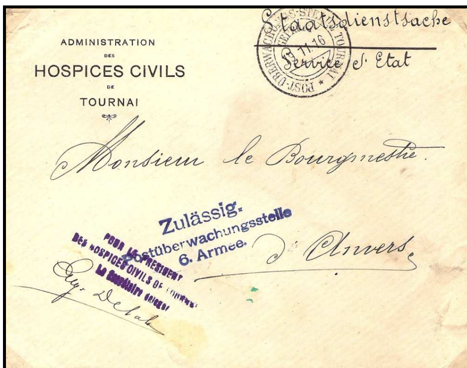
Fig. 3 : « POST-ÜBERWACHUNGS-STELLE TOURNAI » sur lettre datée du 19 novembre 1916, des Hospices Civils de TOURNAI (estampille en bleu).