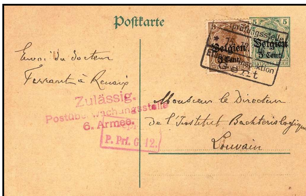
Fig. 6 : Carte postale de RENAIX, datée du 15 décembre 1916, vers LOUVAIN via GAND.

La durée d'utilisation connue de ces estampilles va du 6 octobre 1916 jusqu'au 22 décembre 1916.