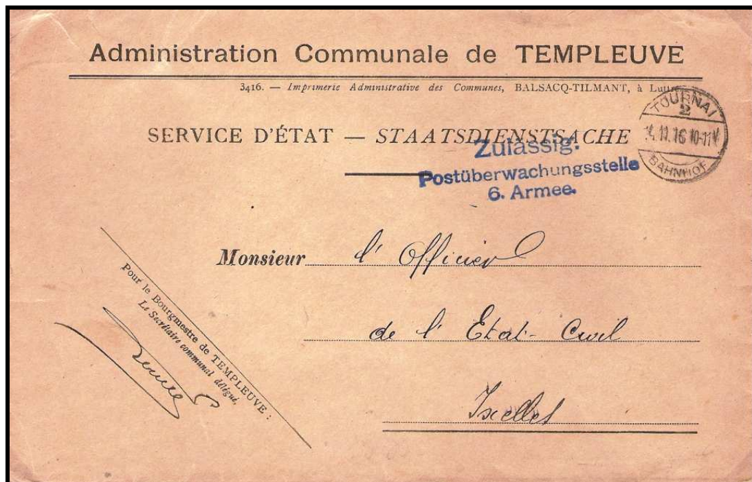
Fig. 2 : « TOURNAI 2 / BAHNHOF » sur lettre, datée du 14 novembre 1916, de la commune de TEMPLEUVE.