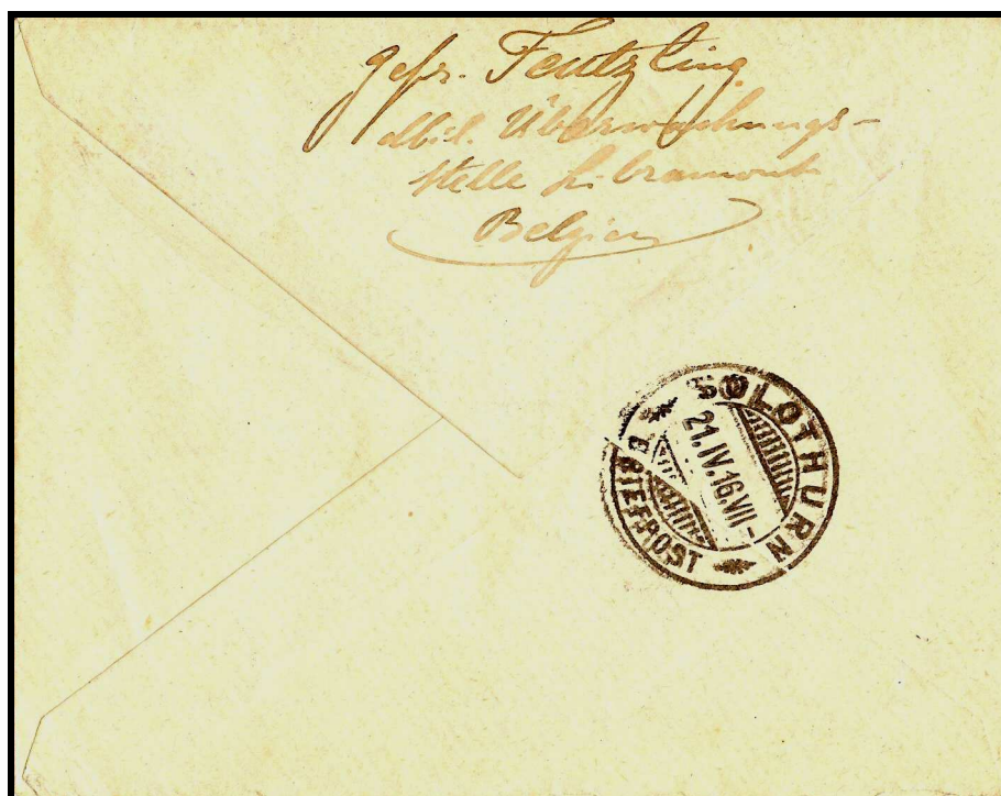
Figure 3 : Verso de la lettre expédiée de LIBRAMONT, datée d' avril 1916, vers SOLOTHURN.

Le mot Feldpost manuscrit surmonte l'adresse du destinataire. Celui-ci est un avocat de SOLOTHURN en Suisse. Le chiffre 37 dans le coin inférieur gauche correspond au numéro du censeur à AIX-LA-CHAPELLE. Le timbre surchargé d'une valeur de 25 centimes est annulé par des traits de crayon violet.