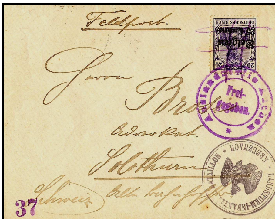
Figure 2 : Recto de la lettre expédiée de LIBRAMONT, datée d' avril 1916, vers SOLOTHURN.

Le mot Feldpost manuscrit surmonte l'adresse du destinataire. Celui-ci est un avocat de SOLOTHURN en Suisse. Le chiffre 37 dans le coin inférieur gauche correspond au numéro du censeur à AIX-LA-CHAPELLE. Le timbre surchargé d'une valeur de 25 centimes est annulé par des traits de crayon violet.