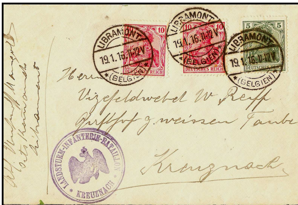
Figure 1 : Lettre expédiée de LIBRAMONT, datée du 19 janvier 1916, vers KREUZNACH.

Le premier document est une enveloppe envoyée de LIBRAMONT le 19 janvier 1916 à destination d'un habitant de la ville de KREUZNACH en Allemagne. L'affranchissement en timbres allemands d'une valeur de 25 pfennigs n'est pas correct. Cette somme excède de 5 pfennigs le port exigé pour l'étranger.