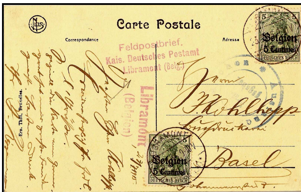
Figure 4 : Carte postale expédiée de LIBRAMONT, datée du 23 juillet 1915, vers BALE.

Notre militaire n'a pas droit à la franchise postale parce qu'il n'écrit pas à un membre de sa famille.